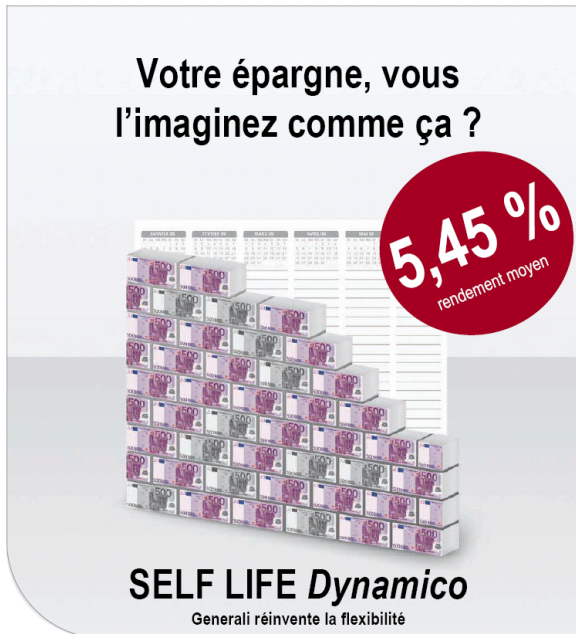
Rémunération nette globale de SELF LIFE Dynamico